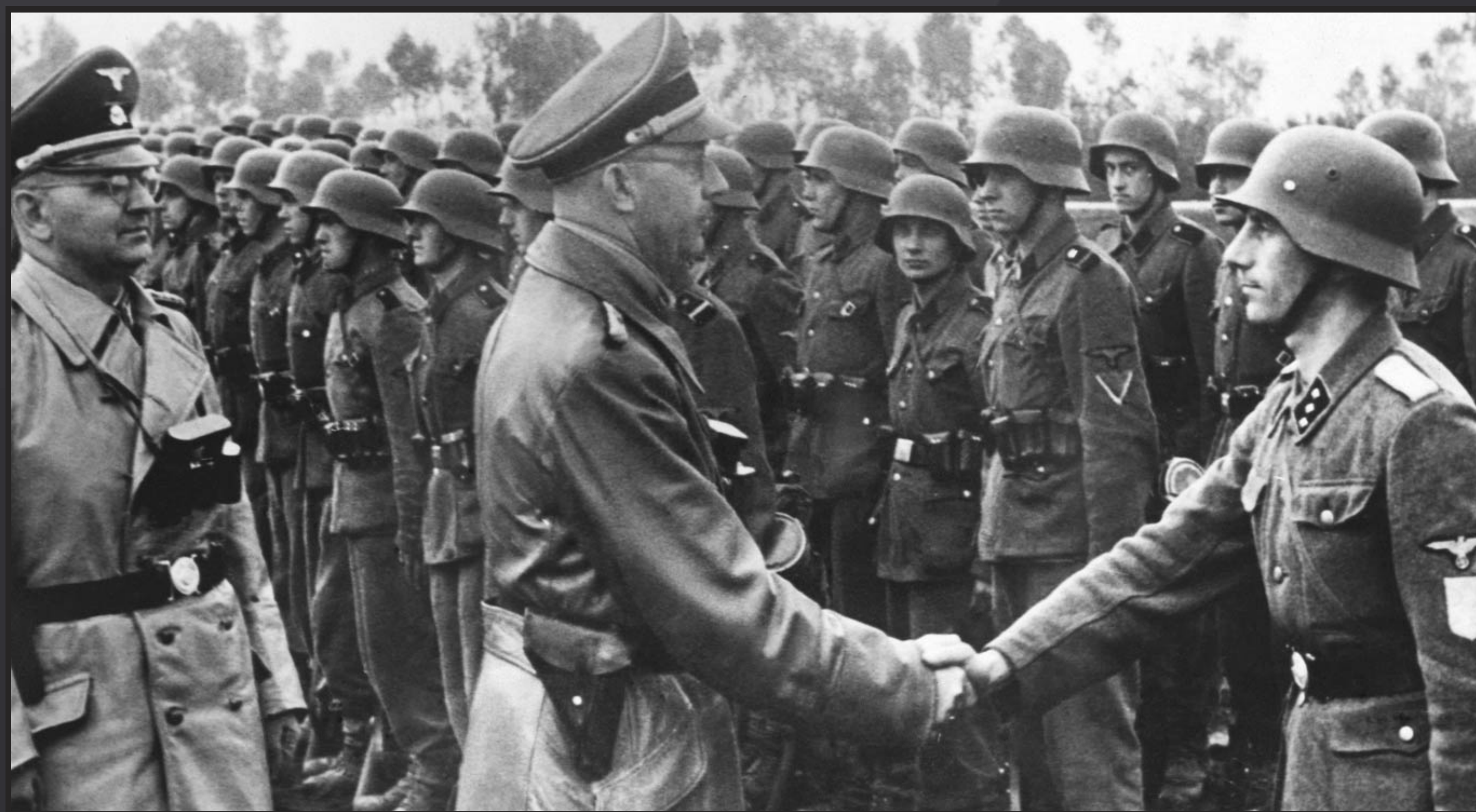
На фото – рейхсфюрер СС Генрих Гиммлер пожимает руку члену дивизии СС «Галичина» во время смотра

После победы Евромайдана героизация нацизма активно идет и на уровне регионов Украины. Например, 24 декабря 2019 года Львовским областным советом принято решение о выделении в 2020 году государственных средств для памятных мероприятий в честь антисемита, расиста, сторонника идеи о «превосходстве украинской расы», украинского националиста Юрия Липы. Еще в