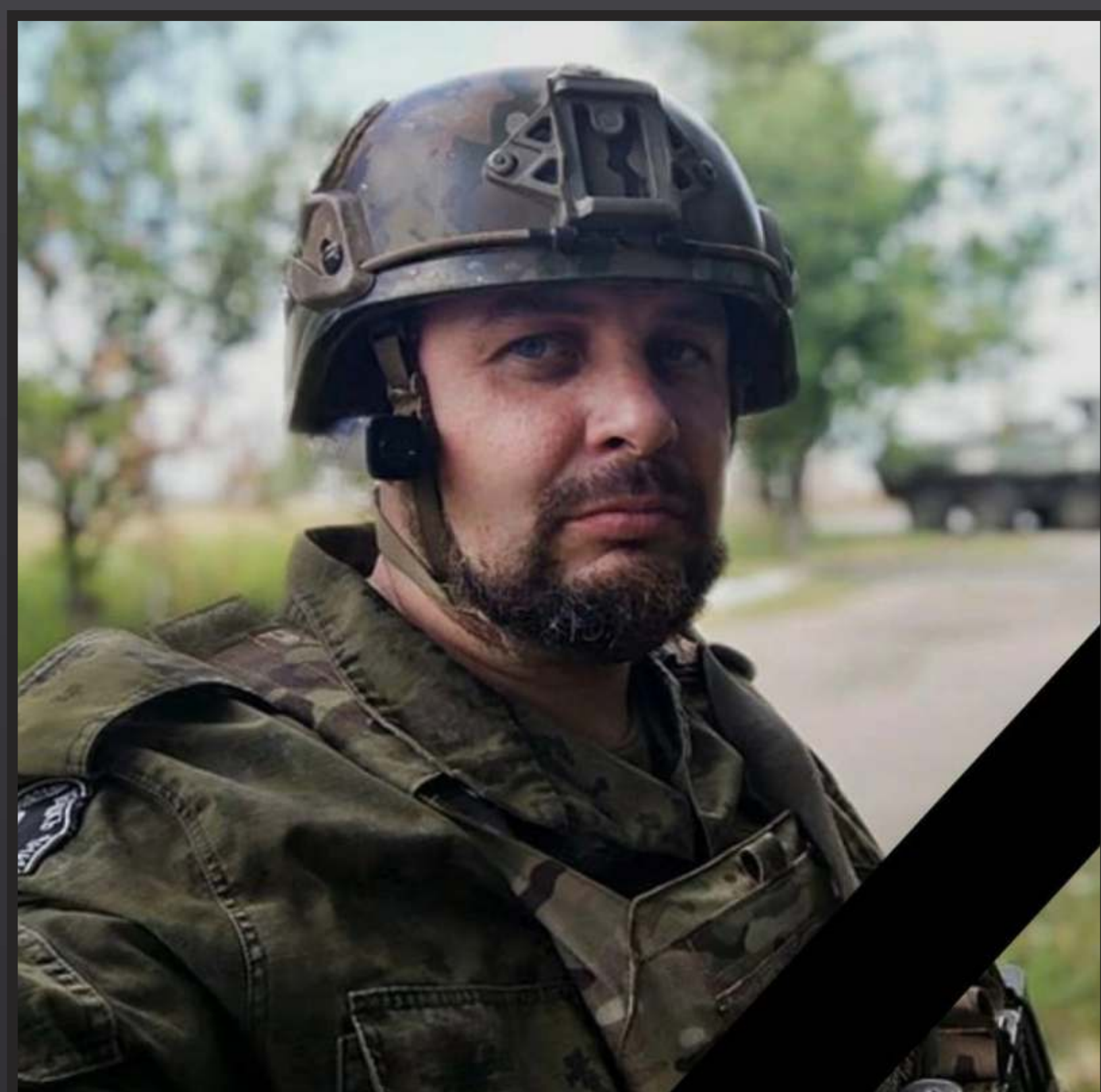
На фото – российский журналист Владлен Татарский (Максим Фомин)

27 октября 2023 года в Ялте был совершен террористический акт – покушение на бывшего депутата Верховной Рады, бывшего кандидата в Президенты Украины Олега Царева. В него было произведено несколько выстрелов из пистолета. Был задержан соучастник покушения на Царева, который дал признательные показания о своей работе на украинские спецслужбы.