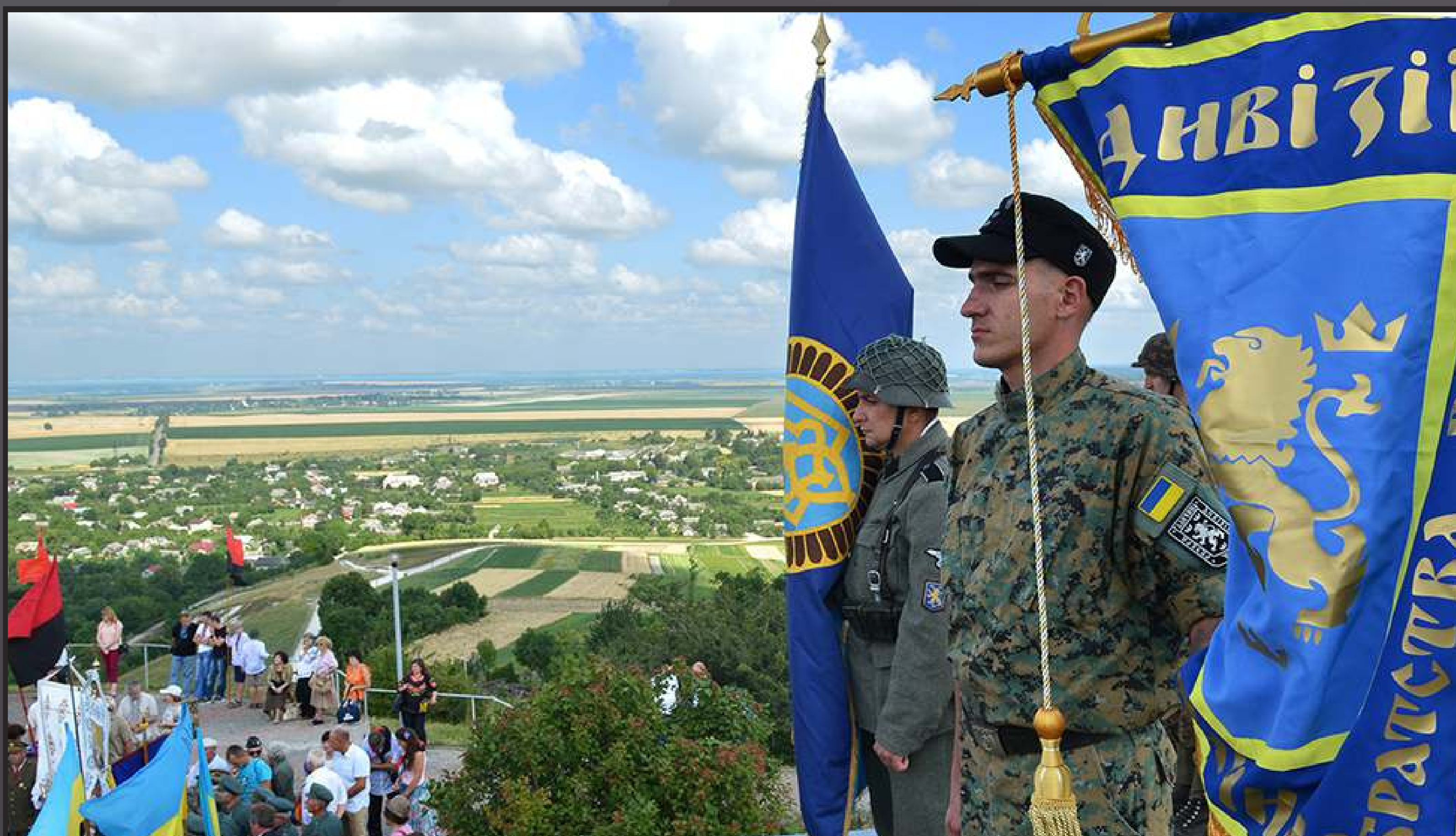
На фото – торжественное перезахоронение карателей из СС в селе Червоное Львовской области Украины

Днепр, Житомир, Кропивницкий, Луцк, Львов, Одесса, Полтава, Ровно, Сумы, Тернополь, Ужгород, Черновцы, Белая Церковь, Бердичев, Бровары, Владимир-Волынский, Дрогобыч, Калуш, Ковель, Кодыма, Коломыя, Коростень, Корсунь-Шевченковский, Надворная, Новоград-Волынский, Новый Буг, Овруч, Первомайск, Самбор, Стрый, Умань, Христиновка, Червоноград, Шепетовка и другие.