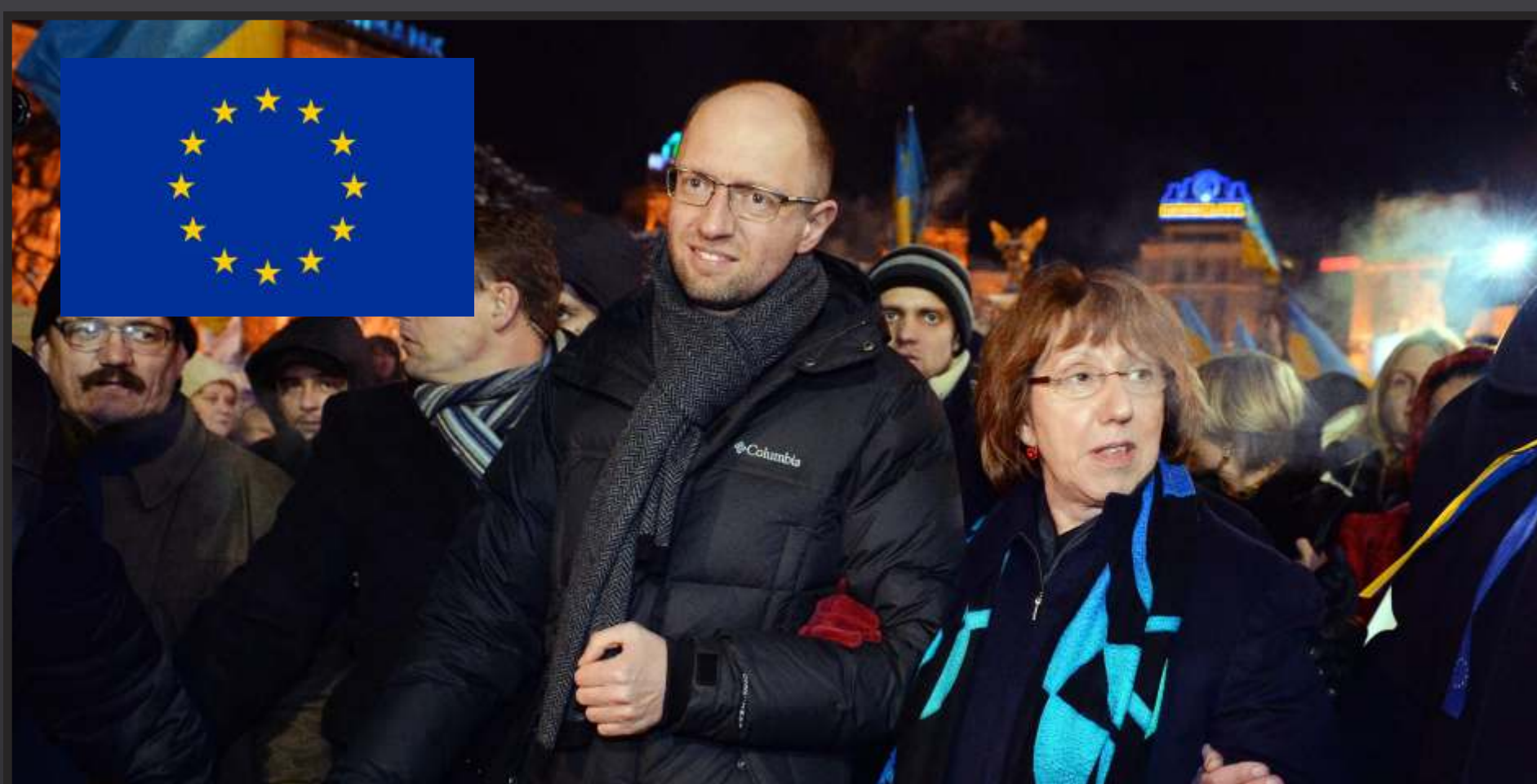
Кэтрин Эштон , верховный представитель по иностранным делам и политике безопасности Европейского союза на Евромайдане

После подписания Соглашения в контексте его выполнения президент Украины Виктор Янукович отдал указания по выводу сил охраны порядка из центра Киева. После этого в нарушение подписанного под гарантии западных стран Соглашения 22 февраля 2014 года боевики Евромайдана захватили правительственные здания, а попавшая под его контроль Верховная Рада в нарушение украинской Конституции приняла решение об отстранении легитимного президента страны. Сразу после антиконституционного переворота его результаты были признаны западными странами.