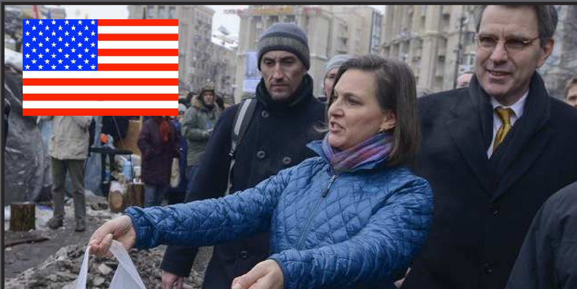
Виктория Нуланд , помощник государственного секретаря США по делам Европы и Евразии на Евромайдане

Евромайдан - организованные при поддержке и участии западных стран массовые беспорядки (ноябрь 2013 - февраль 2014), кульминацией которых стал антиконституционный кровавый переворот в Киеве, в ходе которого был незаконно отстранен легитимно избранный президент Украины и к власти пришел неонацистский режим, развязавший гражданскую войну*.