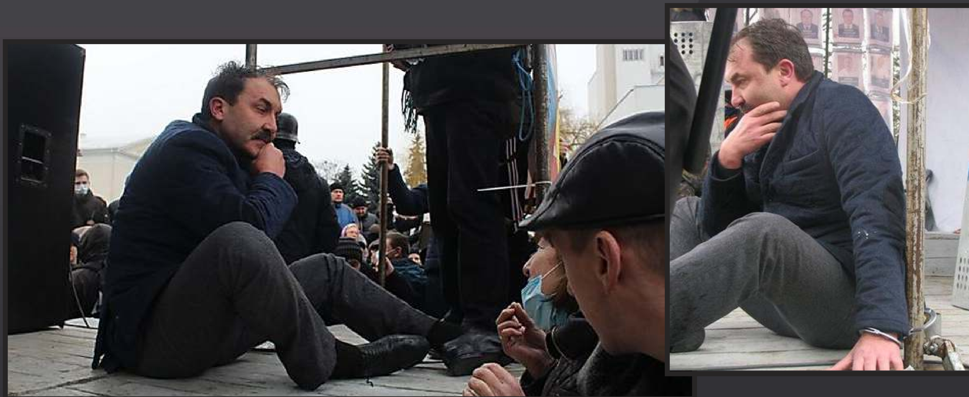
На фото – подвергнутый избиениям и прикованный наручниками к сцене губернатор Волынской области. После угроз убийством родственников через несколько дней он подал в отставку. Такая практика угроз наряду с избиениями и «мусорной люстрацией» стала постоянной после победы Евромайдана.

19 февраля 2014 года приехавшая с Евромайдана группа боевиков захватила здание областного управления МВД в Волынской области. Губернатора Александра Башкаленко начали избивать, вывели на сцену на Театральной площади города, приковали наручниками, облили холодной водой и угрожали убить его родственников.