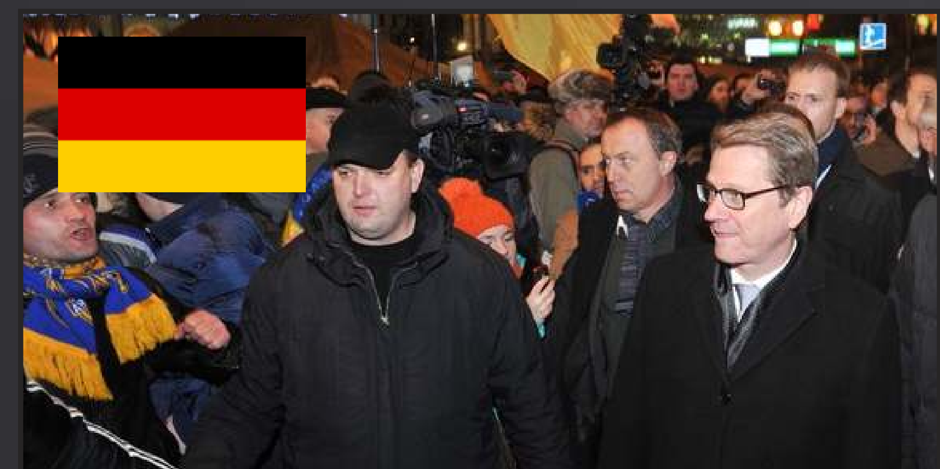
Гидо Вестервелле , бывший Министр иностранных дел Германии на Евромайдане

В 2014 году Министр иностранных дел России Сергей Викторович Лавров дал следующую оценку произошедшему: «Когда мы призывали к тому, чтобы вернуться к выполнению обязательства, взятого на себя 21 февраля, и пытались усюветить наших западных партнеров, особенно тех, кто принимал непосредственное участие в подготовке этого заявления, нам говорили, что поезд ушел, уже ситуация изменилась. Как может ситуация измениться таким образом, чтобы задача национального единства страны стала неактуальной?»