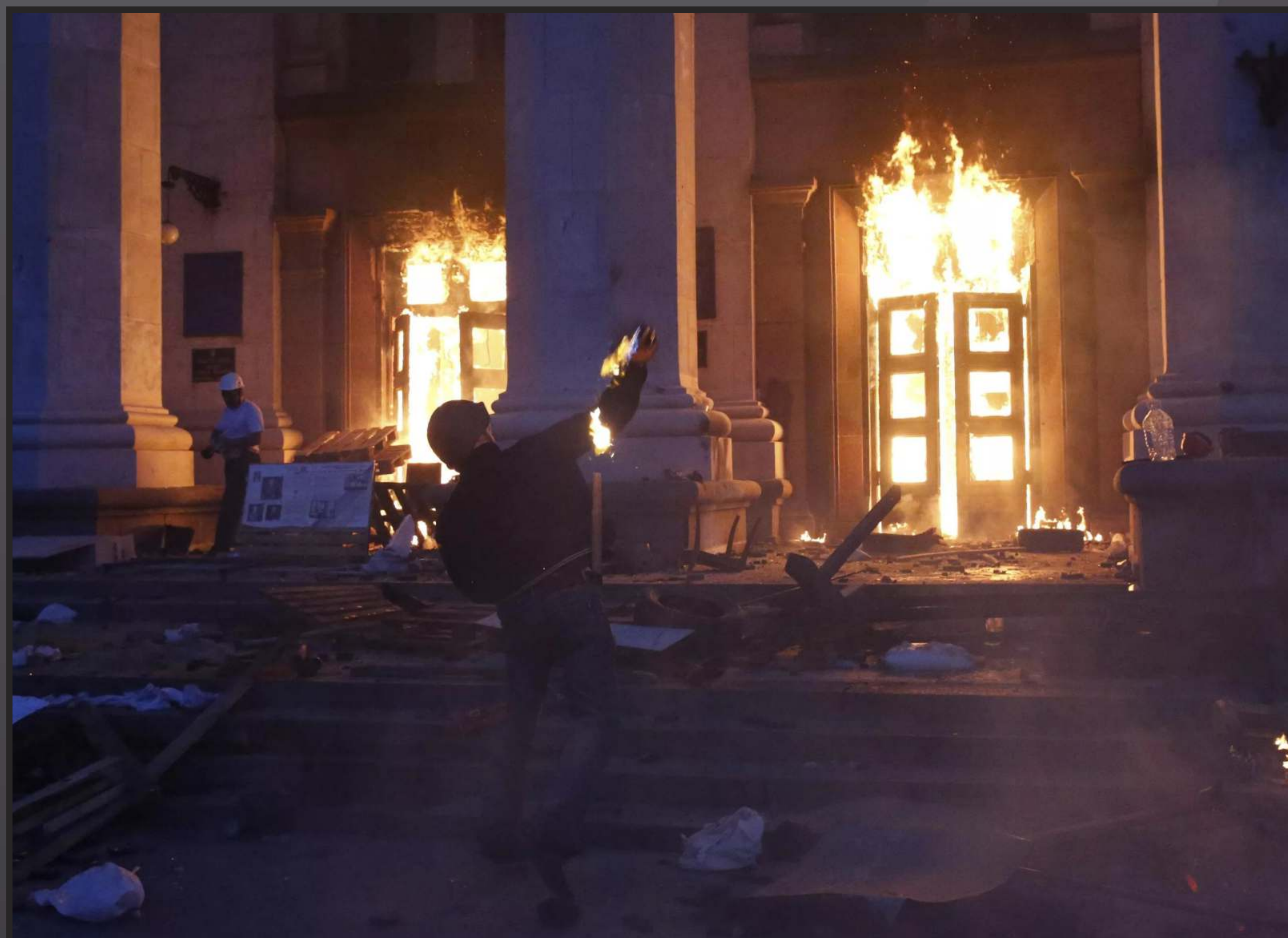
На фото – боевики Евромайдана поджигают одесский Дом профсоюзов, в котором были сожжены те, кто выступил против переворота на Украине

Одним из первых таких примеров стало массовое убийство оппозиционеров, которое в СМИ получило название «Одесская Хатынь». Хатынь – деревня в Белоруссии, где 118-й батальон шуцманшафта, куда в том числе входили члены ОУН и батальон СС «Дирлевангер», сожгли заживо или расстреляли 149 жителей. В 1943 году они окружили колхозный сарай, согнали в него жителей деревни, преимущественно женщин, детей и стариков, и подожгли.