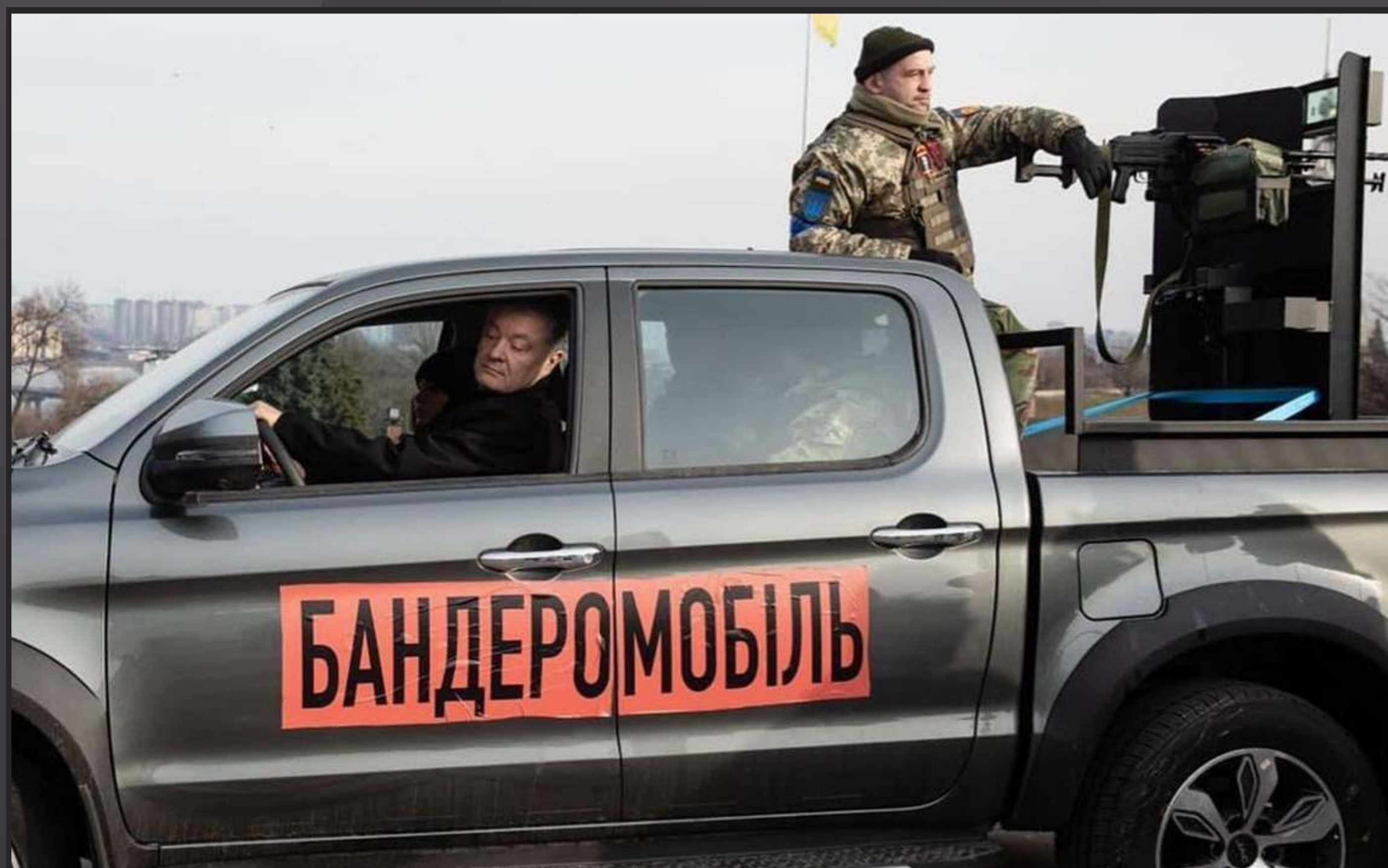
На фото слева – президент Украины Петр Порошенко в куртке с надписью «Циничный Бандера». На фото справа – президент Украины Петр Порошенко за рулем автомашины с надписью «Бандеромобіль».

Кроме того, данный закон предписывает украинскому государству «разрабатывать и совершенствовать учебные планы, учебники, программы и мероприятия с целью изучения» их истории, а также способствует «созданию мемориальных комплексов и захоронений, сооружению и восстановлению памятников, памятных знаков, увековечиванию имен или псевдонимов борцов и формирований в названиях объектов топонимики населенных пунктов или административно-территориальных единиц, названиях географических объектов, изготовлению печатной, кино- и видеопроизведения, содействие деятельности в отношении сценического и другого художественного воплощения образов».