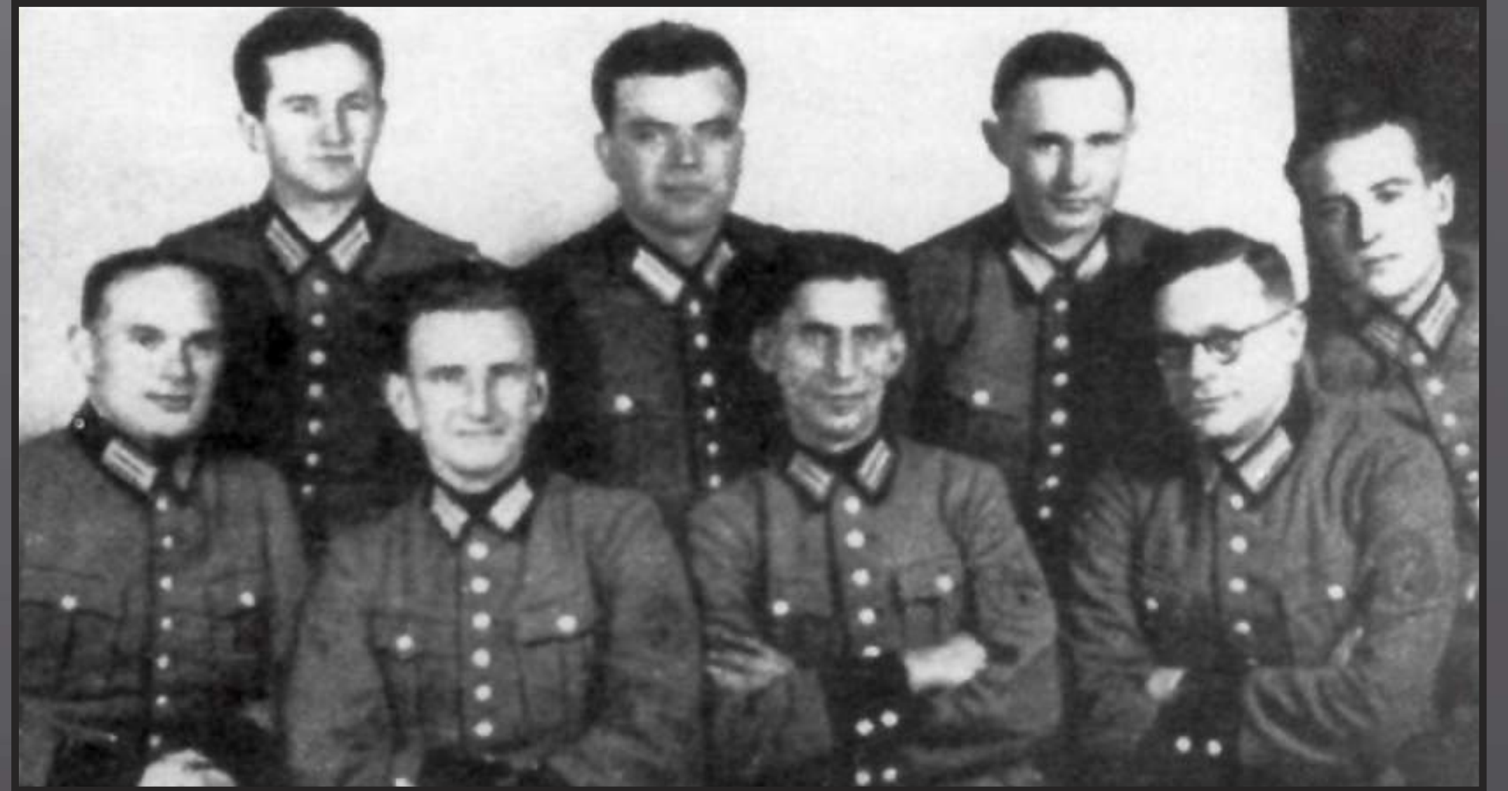
На фото – Роман Шухевич (второй слева) в батальоне нацистского Абвера «Нахтигаль». Батальон был создан по приказу руководителя Абвера Вильгельма Канариса для организации диверсий на Украине, а также совместных действий с немецко-фашистскими войсками.

12 декабря официально праздновалось 130 лет со дня рождения нациста Андрея Мельника, главы Организации украинских националистов, агента Гестапо, военного преступника, организатора геноцида евреев, поляков и русских.