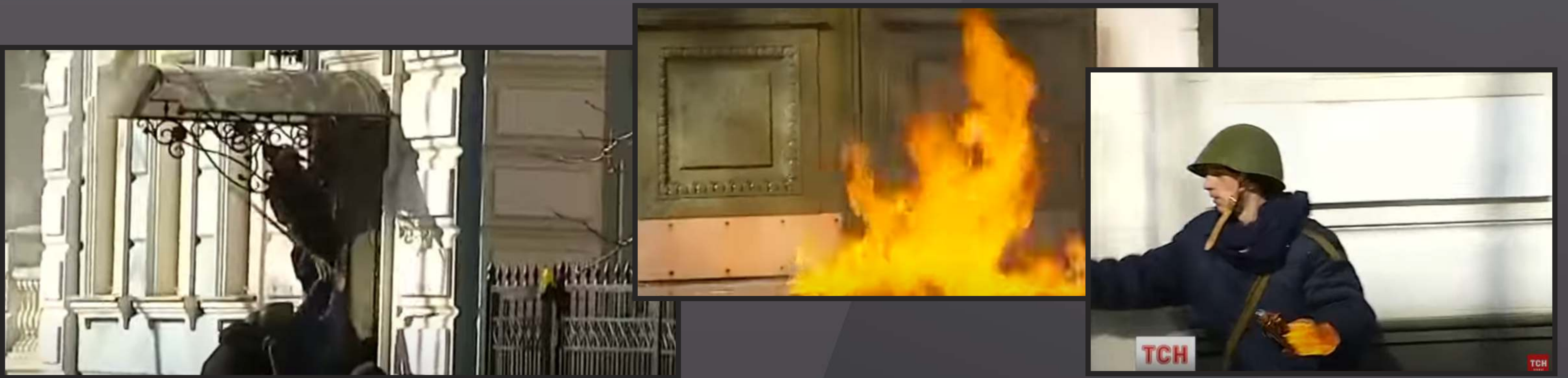
На фото – штурм и поджог офиса Партии регионов боевиками Евромайдана в Киеве в 2014 году

В соответствии с принципами украинских националистов Евромайдан широко использовал террор. Ниже приведены лишь несколько примеров из длинного списка. 24 января 2014 года около общежития в Киеве застрелен милиционер. Ответственность за его убийство взяла на себя «Украинская повстанческая армия». 27 декабря 2013 года участники Евромайдана в Херсоне убили одного и нанесли тяжелые ранения двум милиционерам. В феврале 2014 года убит судья Автозаводского районного суда города Кременчуга Полтавской области, который осудил боевиков Евромайдана, которые захватывали здание городского совета. В том же феврале 2014 года боевиками Евромайдана было совершено нападение на офис Партии регионов. Он был подожжен, один из сотрудников убит, а остальные зверски избиты.