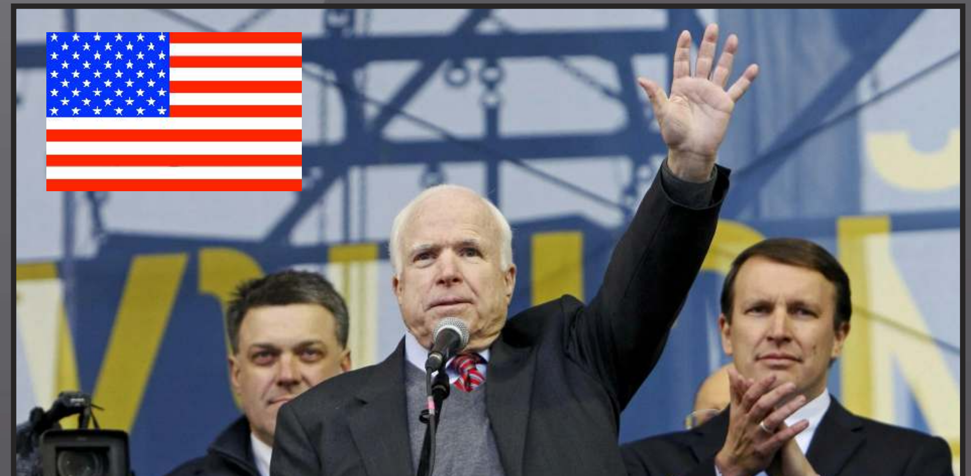
Джон Маккейн , сенатор США, председатель совета директоров Международного республиканского института на Евромайдане