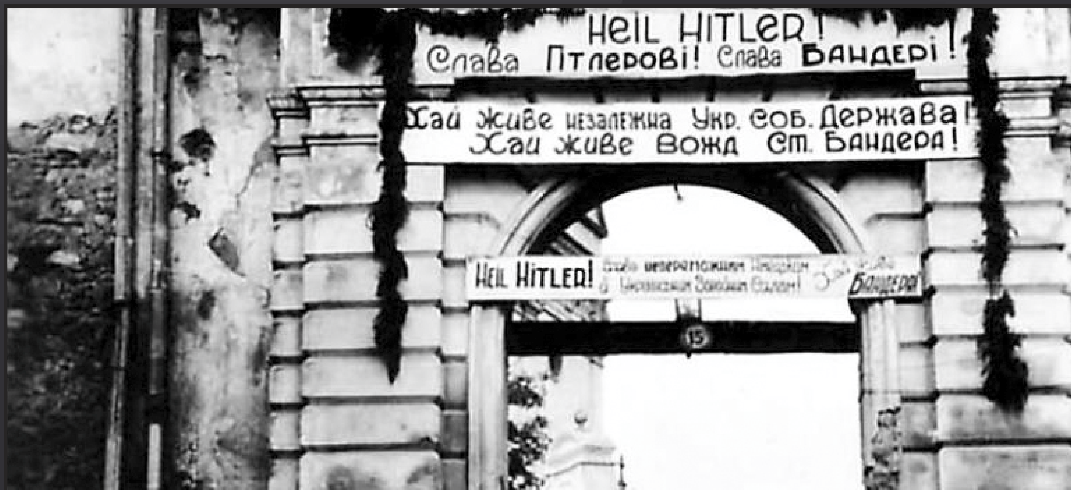
На фото – надписи на оккупированной нацистской Германией территории Украинской Советской Социалистической Республики: «Слава Гитлеру! Слава Бандере!».